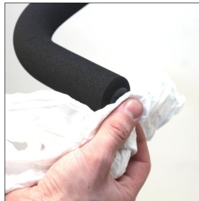
Torka sedan bort den överblivna vätskan.