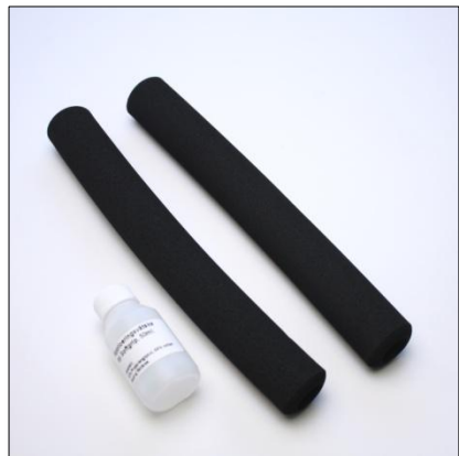
Softgrip och vätska