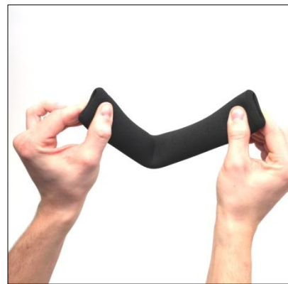
Nyp sedan ihop ändarna och ruska lite så att vätskan kan komma åt överallt.