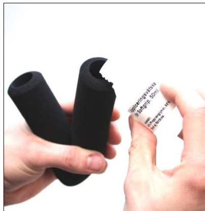
Börja med att vika softgripen på mitten håll sedan i lite av vätskan.