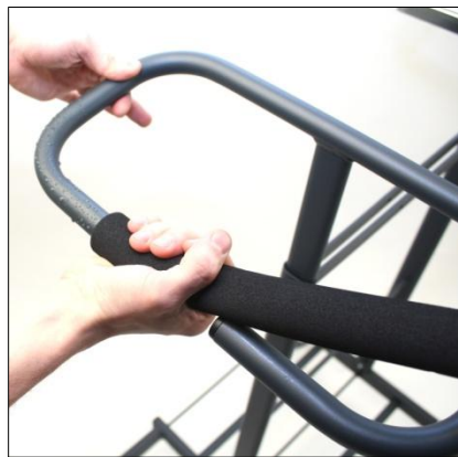
Genom att vrida och trycka samtidigt får man lätt på softgripen på styret.