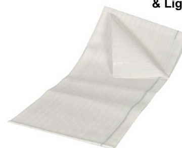
Ultra Light & Light